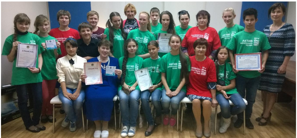
На снимке участники конкурса.